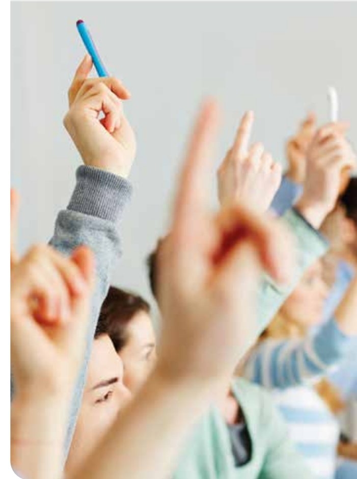
Titelbild: Robert Kneschke © fotolia.com